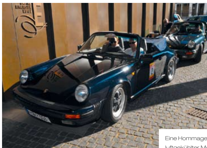
Eine Hommage an vier Jahrzehnte luftgekühlter Motoren.