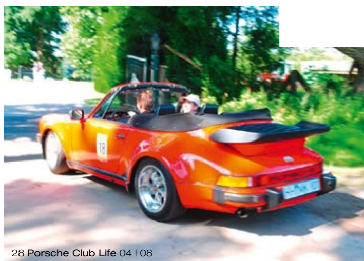
28 Porsche Club Life 04 | 08