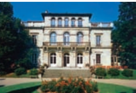
Medau-Schule auf Schloss Hohenfels in Coburg