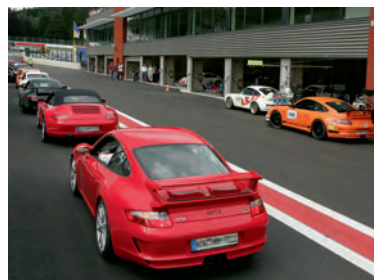
▲ Startaufstellung zur Instruktionssfahrt.

Weitere Informationen über den Porsche Sports Cup finden Sie unter www.porschesportscup.de