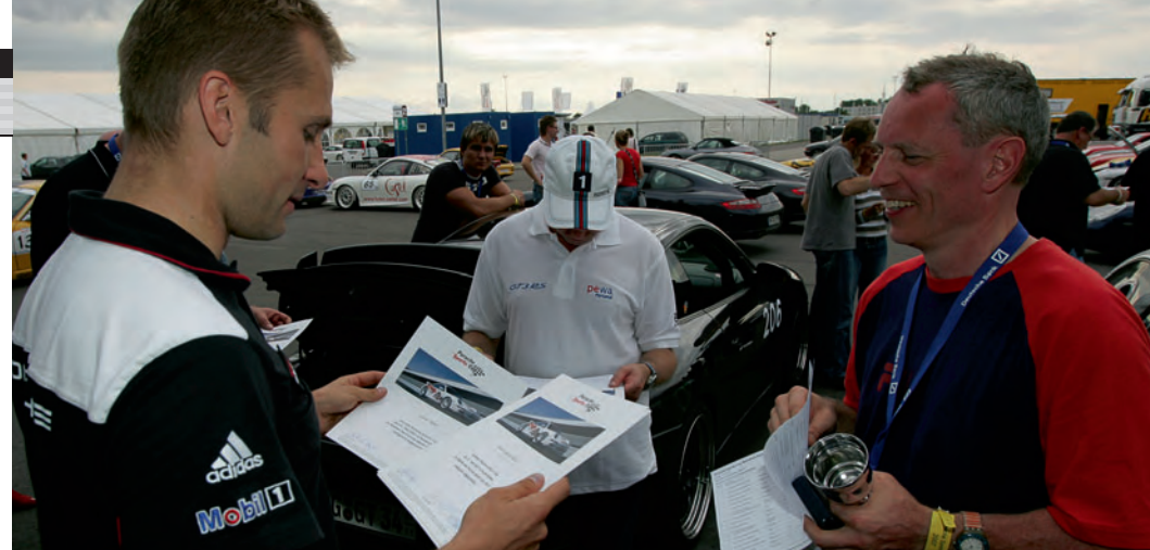
▲ Siegerehrung beim Porsche Driver's Cup.