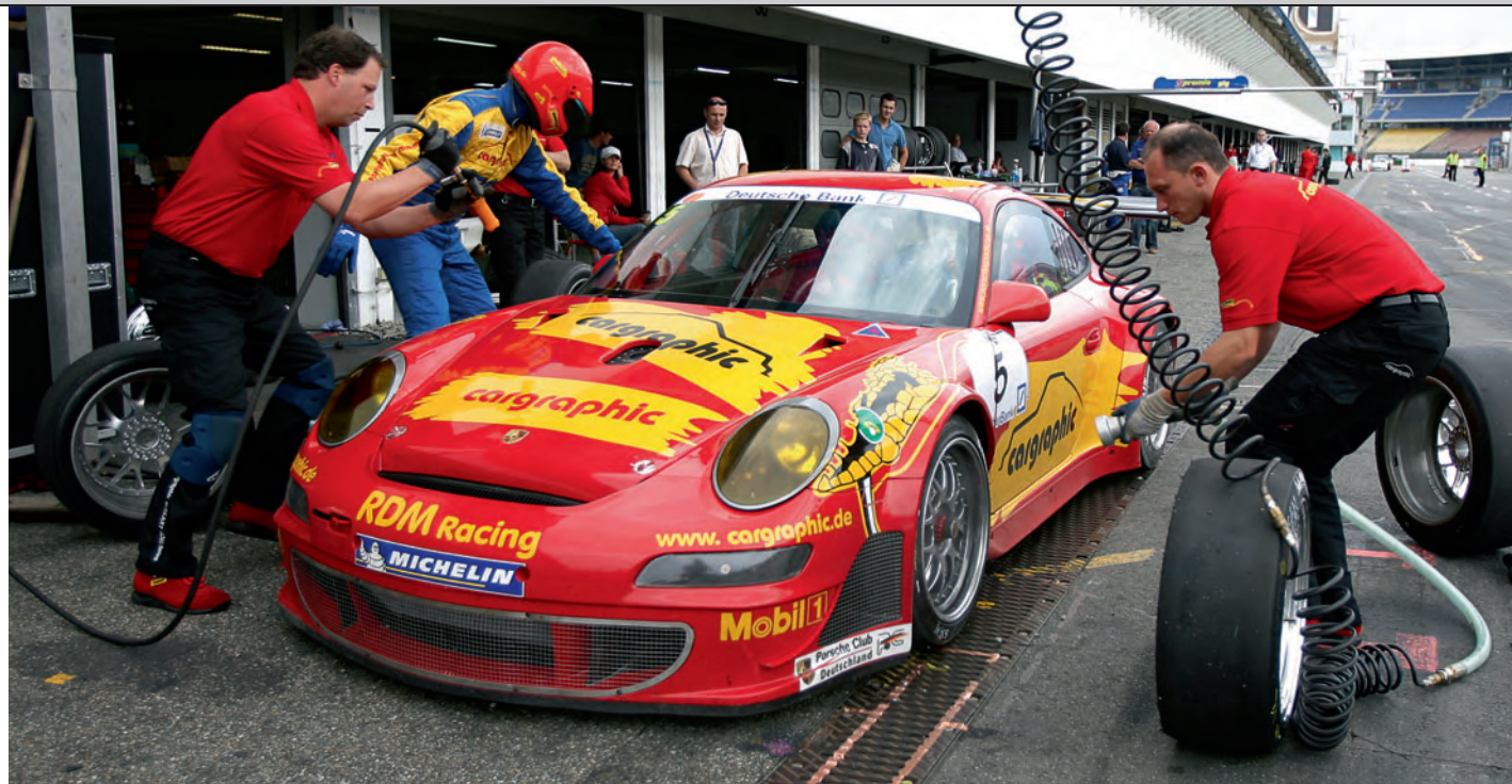
▲ Fliegender Wechsel bei der Porsche Sports Cup Endurance.

Beim Porsche Sports Cup hautnah dabei: Erleben Sie aufregende Wettkämpfe, spannende Qualifyings, besuchen Sie das Fahrerlager und die Boxengasse, reden Sie mit den Fahrern, und informieren Sie sich in aller Ruhe über die aktuellen Porsche Produkte – 911, Boxster, Cayman und Cayenne. Und nehmen Sie sich ein Stück Porsche mit nach Hause – aus unserem Shop mit den aktuellen Accessoires der Porsche Design Driver's Selection.