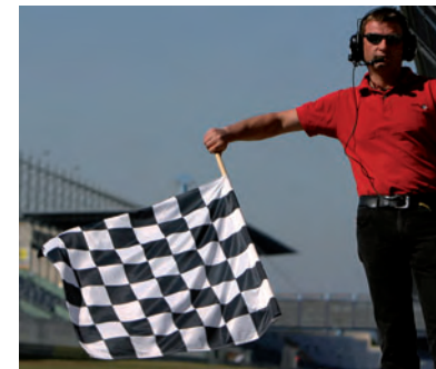
▲ Das Ziel ist erreicht.