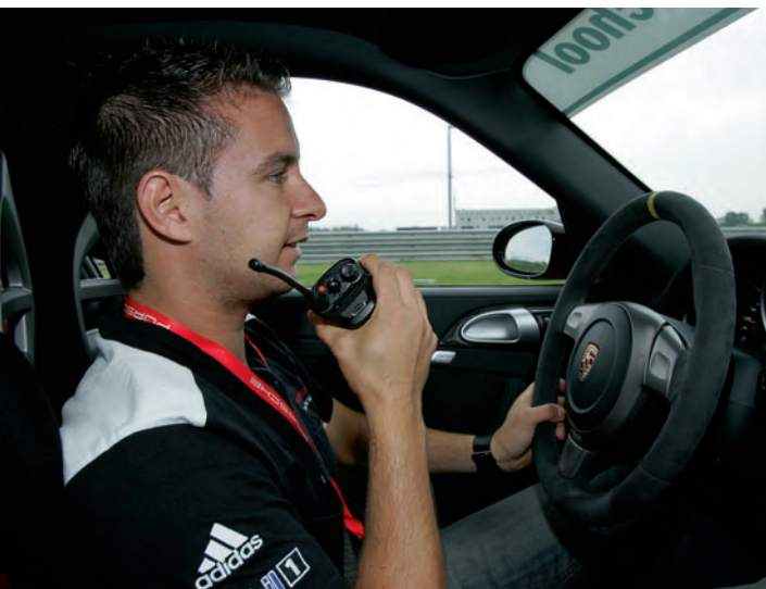
▲ Professionelle Instruktionen der Porsche Sport Driving School.

Das detaillierte Programm und alle wichtigen Informationen gehen den Teilnehmern ca. eine Woche vor dem jeweiligen Veranstaltungsbeginn zu.