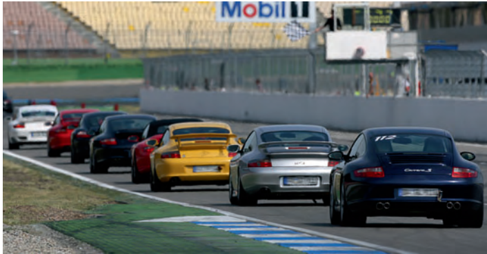
▲ Der Porsche Driver's Cup bringt die gesamte Vielfalt der Porsche Modellpalette auf die Rennstrecke.

Teilnehmen dürfen alle Besitzer eines gültigen Führerscheins. Wer nicht mit dem eigenen Porsche teilnimmt, benötigt die schriftliche