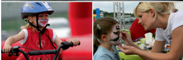
▲ Früh übt sich: die Rennfahrer von morgen.

Weitere Informationen, Details für interessierte Fahrer und Zuschauer sowie die Meldeformulare finden Sie unter www.porschesportscup.de . ■