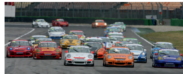
▲ Spannende Positionskämpfe während der Rennen.