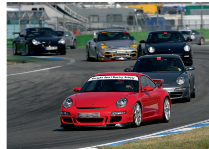
▲ Erfahrene Instruktoren der Porsche Sportfahrschule vermitteln das Wissen zur Ideallinie.

Dessen ungeachtet bestehen jedoch auch dann keine Ansprüche, wenn der Schaden durch eine unsachgemäße Behandlung oder Überbeanspruchung des Fahrzeugs entstanden