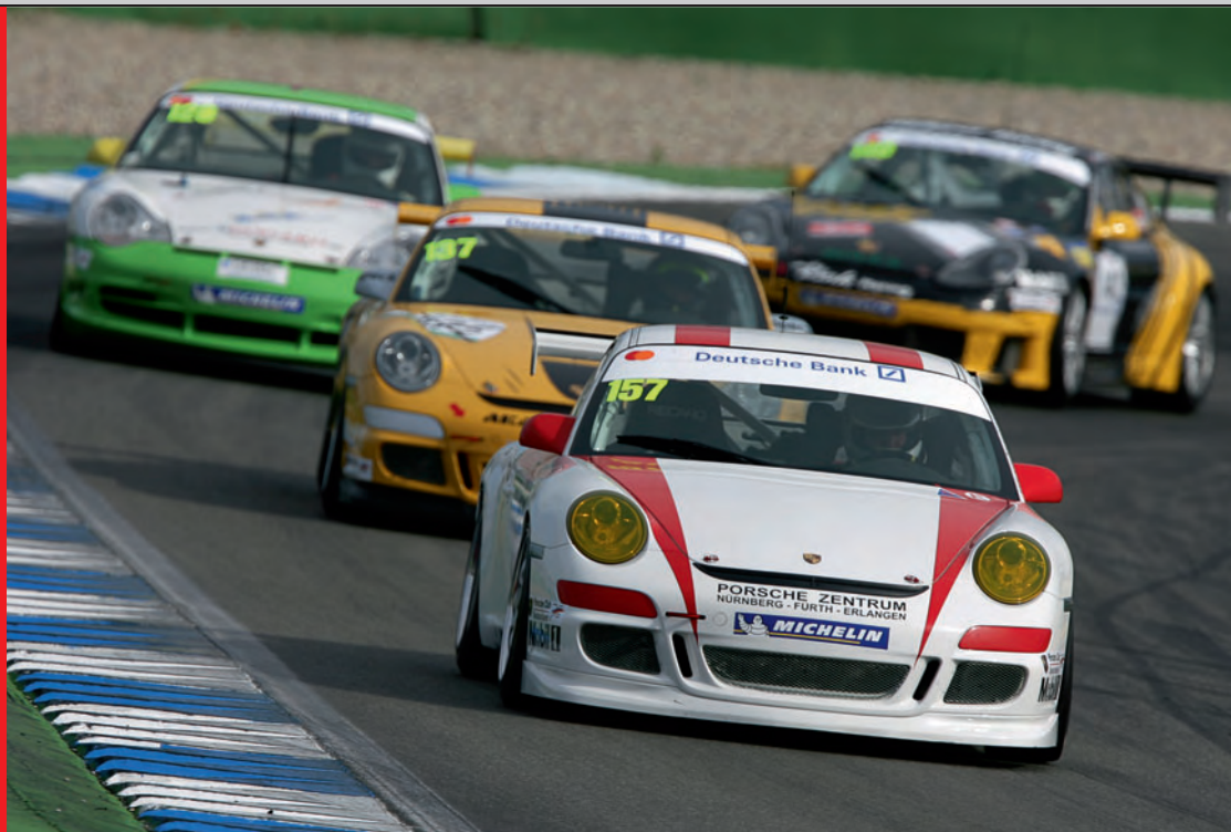
▲ Porsche Sports Cup pur.