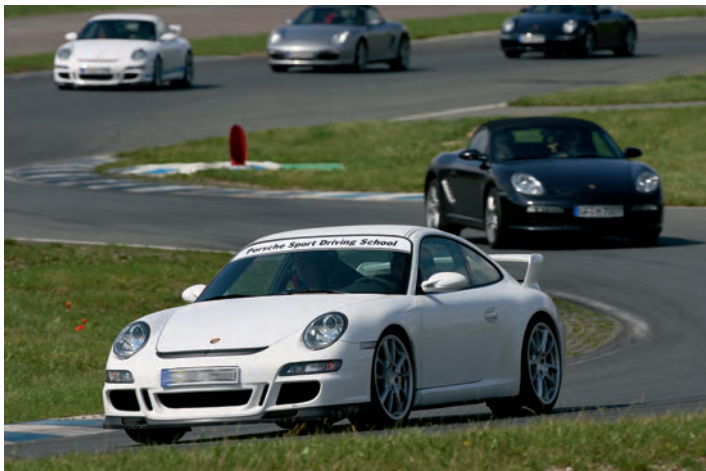
▲ Geführtes Fahren auf der Rennstrecke.

Bei der Führung durchs Fahrerlager haben Sie die Möglichkeit, mit den Teams und Fahrern zu sprechen. Schauen Sie sich die Rennfahrzeuge in den Boxen aus der Nähe an und werfen Sie einen Blick hinter die Kulissen: im Rennbüro, bei der technischen Abnahme und in der Zeitnahme. Natürlich alles in Begleitung erfahrener Porsche Instrukteure, die Ihnen mit Rat und Tat zur Seite stehen.