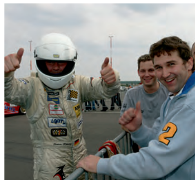
▲ Der Porsche Sports Cup: ein voller Erfolg.

Weitere Informationen, Details für interessierte Fahrer und Zuschauer sowie die Meldeformulare finden Sie unter www.porschesportscup.de . ■