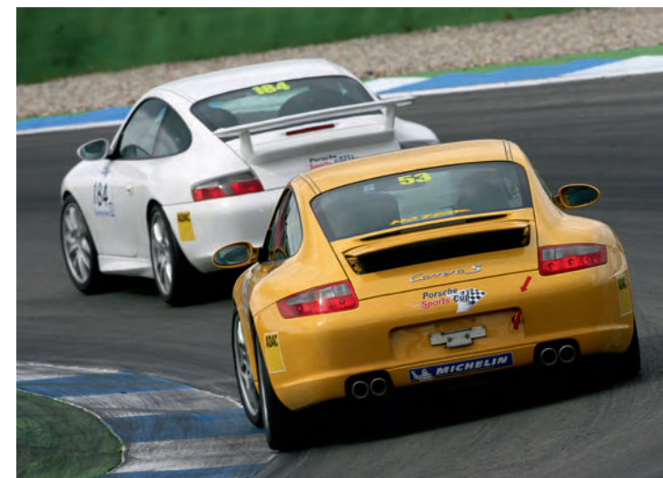
▲ Instruktionfahrten beim Porsche Driver's Cup.