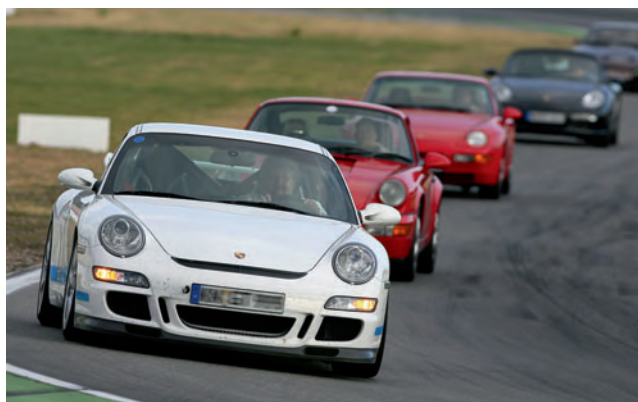
▲ Straßenfahrzeuge zeigen auf der Rennstrecke ihr Können.